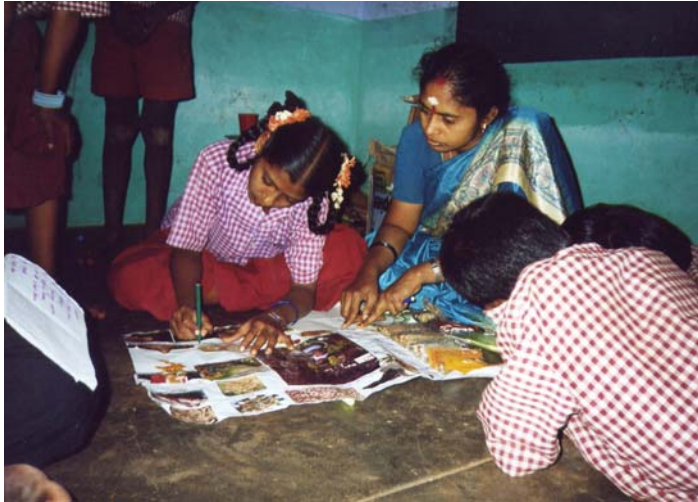
Scuola di Ayyanarpuram: impegnati a preparare materiali da mandare in Italia