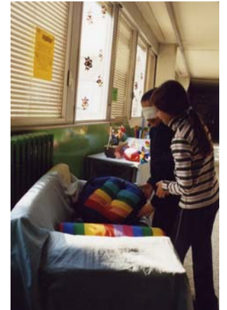
Due occhi in due

I bambini sono divisi a coppie: uno è bendato, l'altro è la guida. La coppia passeggia nell'aula esplorando l'ambiente, toccando le cose e le persone. Dopo qualche minuto I bambini della coppia cambiano i loro ruoli.