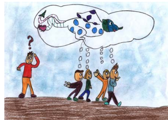
Lo zoo fantastico

I bambini sono divisi a coppie: uno è bendato, l'altro è la guida. La coppia passeggia nell'aula esplorando l'ambiente, toccando le cose e le persone. Dopo qualche minuto I bambini della coppia cambiano i loro ruoli.