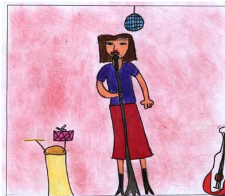
Vorrei essere... una famosa cantante!