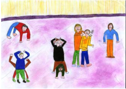
Saluti con il corpo