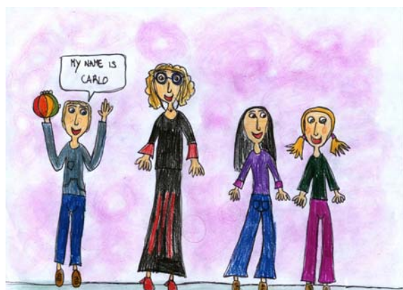
Palla - nome