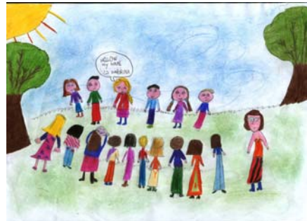
Nome più gesto

I bambini sono in cerchio. Il primo dice il suo nome ed esegue un gesto specifico (es. “Il mio nome è Rajendran” e salta). Il bambino successivo alla sua sinistra deve dire: “Lui è Rajendran” e salta, poi presenta se stesso nello stesso modo (es. “Il mio nome è Pandyan” e batte le mani).