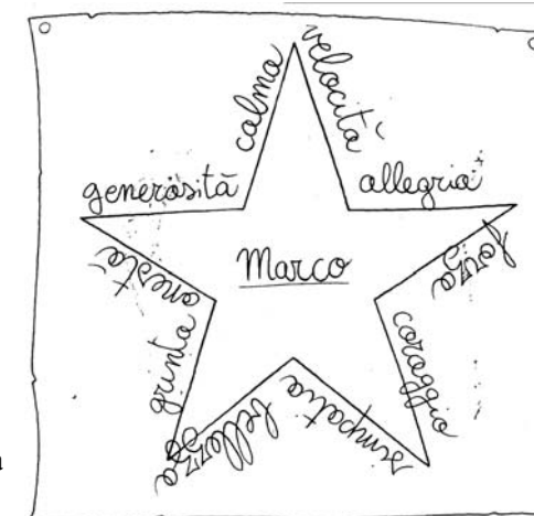
Disegnando la stella