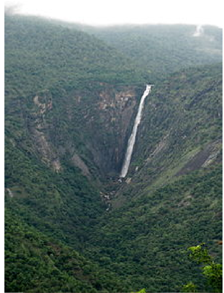
Palani Hills Wildlife Sanctuary and National Park